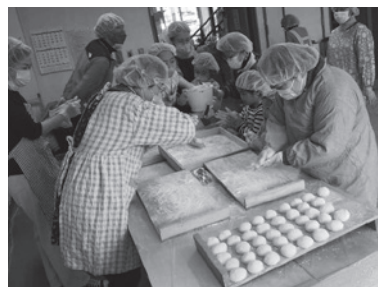
役員の女性たちが、力を合わせて手際よく、たくさんの餅を丸めました

外でもち米を蒸し、きねと臼で餅つき、餅を丸め、手作りぜんざい、大根おろしあえ、きなこ餅、のりとしょう油、参加者一同おなかいっぱいになりました。 餅つきの後、子どもたちは元氣いっぱい外で遊びました。