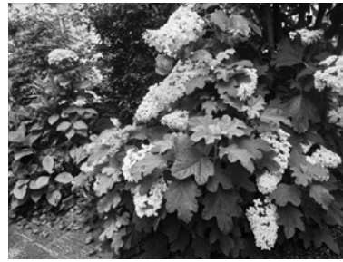
カシワバアジサイ 新甲陽町・昨年6月撮影