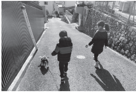
わんわんパトロールのイメージ

ル」の導入に向けて鋭意準備を進めています。 配布されたグッズを付けて、いつものように犬の散歩をするだけでOKです。特に特別な行動などは必要ありません。私自身が委員として参加している学校運営協議会による財源確保も見込まれ、少しずつではありますが、実現に向けて進んでいます。今年度中にはこれをスタートさせ、保護者だけではなく、地域として子どもたちを見守り、今まで以上に子育てしやすい街へとつながっていかれると思います。