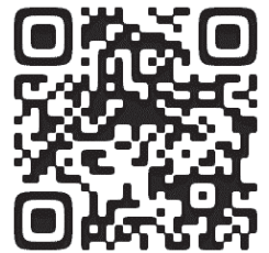
甲陽園夏まつりHPの二次コード

夏まつり実行委員会とは、自治会と商店、甲陽園小学校、PTA、地域活動団体などから資金援助や人的援助を得ながら、地域の人々が世代を超えて交流できる「まつり」の開催を目的としたボランティア組織です。 委員会のメンバーは、さまざまな団体からの出身者です。