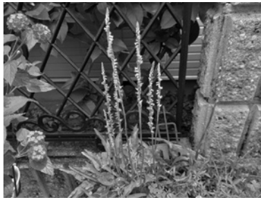
モジズリソウ(ネジバナ) 甲陽園日ノ出町・昨年6月撮影