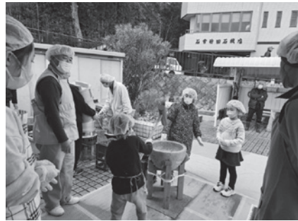
子どもたちも杵もちつき体験