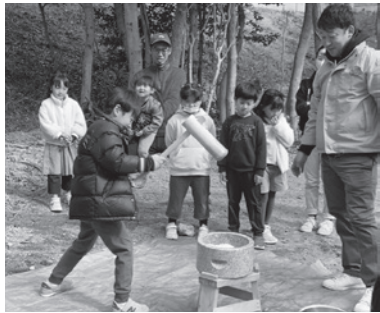
子どもたちも頑張りました

ル」の導入に向けて鋭意準備を進めています。 配布されたグッズを付けて、いつものように犬の散歩をするだけでOKです。特に特別な行動などは必要ありません。私自身が委員として参加している学校運営協議会による財源確保も見込まれ、少しずつではありますが、実現に向けて進んでいます。今年度中にはこれをスタートさせ、保護者だけではなく、地域として子どもたちを見守り、今まで以上に子育てしやすい街へとつながっていかれると思います。