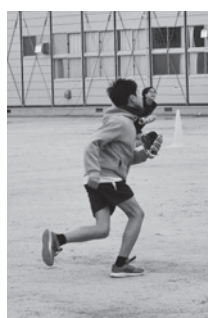
グローブを手に走る!