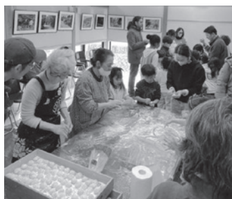
大人に教わりながら、子どもたちも餅を丸めました

外でもち米を蒸し、きねと臼で餅つき、餅を丸め、手作りぜんざい、大根おろしあえ、きなこ餅、のりとしょう油、参加者一同おなかいっぱいになりました。 餅つきの後、子どもたちは元氣いっぱい外で遊びました。