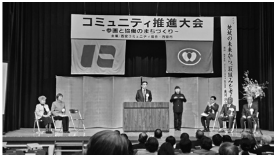
コミュニティ推進大会であいさつをする石井登志郎西宮市長