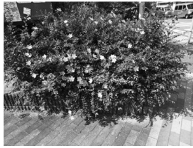
ビヨウヤナギ 甲陽園本庄町・昨年6月撮影