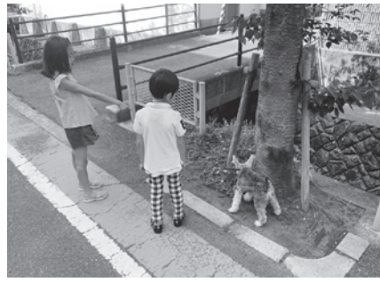
犬を大切に飼う地域です

甲陽園小学校エリアはカーブや勾配が多く、さらには歩道の整備が追いついておらず、子どもたちの安全面においてさまざまな危険が潜むエリアとなっております。 そのような中、近年の子育て世代における共働き世帯の増加に伴って人的確保が難しくなり、子どもたちの「見守り」環境も大きく変化してきました。 そこでこの度、「保護者の安心」と「子どもたちの安全」を向上させるとともに、「地域の防犯力向上」を実現するために、近隣都市の事例を参考とした「わんわんパトロー