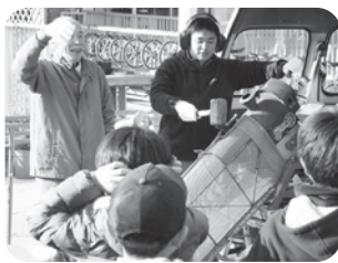
耳をふさいで〜3・2・1