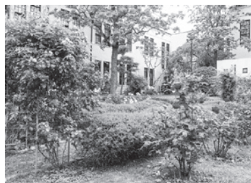
「文学部近くのバラ園」

夜になると花を閉じることから、「睡眠をとる蓮(はす)」ということがその名の由来といわれています