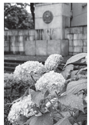
「中央講堂横のアジサイ」

文学部近くにバラ園があります。以前は自然愛好会の学生が世話をしていたそうですが、現在は業者が行っています