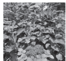
「梅広場のアジサイ」