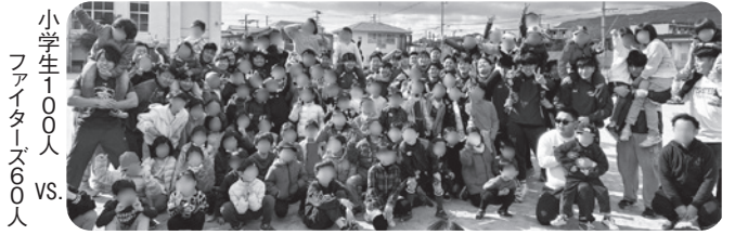
小学生1000人 ファイターズ60人