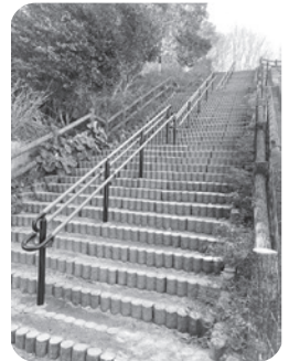
長い階段も安心に

2月に、ゆりのガーデンの斜面にタイムロンギカウリス6060株が植えられました。グラウンドカバーとして広がり、開花は4~6月で、香りも楽しめるそうです。