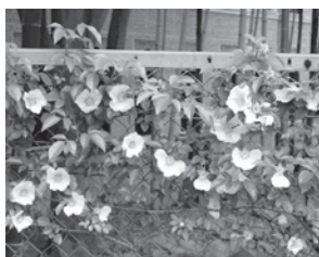
「フェンスのナニワイバラ」