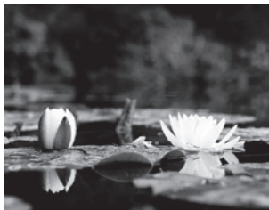
「日本庭園のスイレン」

美しい香りのバラ 優雅なフジやユリ 水辺のスイレンやショウブ 雨の日も楽しめるアジサイ 元気をくれる花々に会いに 出かけてみませんか