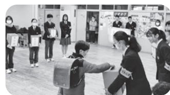
小学校での募金活動