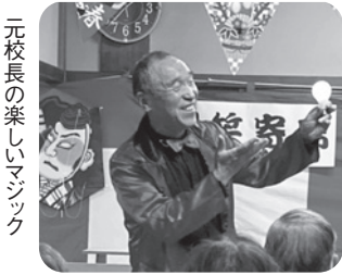
元校長の楽しいマジック

来場者には若者や周辺住民も増え、開催の目的である多世代交流がかないました。(なないろの会主催)