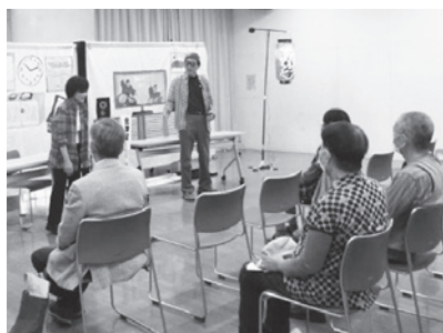
迫力の演技につい力が...