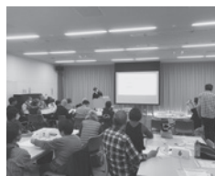
防災部会と広報部会(西宮浜マリナコミュニティ)と共催で開催