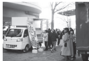
(取材:海のまち 保岡)

住民の皆さんが心待ちにしていたイベントの復活で、目玉はキッチンカーの導入です。今まで経験がないことだけに、コミュニティ委員会を中心に理事会でも食数やタイムスケジュールなどを何度も話し合い、ドキドキしながら当日を迎えました。「住民は集まってくれる?」「キッチンカーの食事は売れるのかな?」という不安はすぐに吹き飛んでしまうほどの人出とたくさんの方々の笑顔にほっと胸をなで下ろしました。