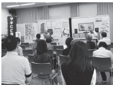
防犯講座を熱心に聞く参加者