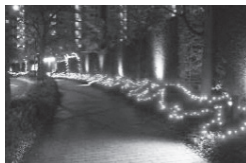
杜のまちや港のまちの道路側にも、イルミネーションで海のまちとつながりました

もう一つの初は「西宮浜まちじゅうミュージアム」との同時開催です。昼間は模擬店を行い、点灯式のクライマックスのメインツリーの点灯後、神戸女学院大学の学生と共に全員で『ふるさと』の合唱をしました。「阪神・淡路大震災後にできたこの街が、子どもたちのふるさとになる日が来るように」との願いがかなったと参加者全員で感じた瞬間でした。新しい点灯式の幕開けの予感がありました。