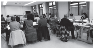
グループで出した意見を発表