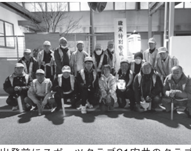
出発前にスポーツクラブ21安井のクラブハウス前に集まった皆さん

年の瀬の夜回りへ 昨年末も歳末特別警戒が実施され、17人が分かれて地域内を見回りました。 （安井地域防犯協議会） 12/26