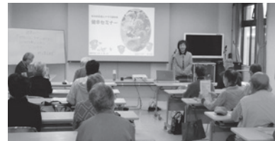
いつもの楽しい語り口で、あっという間の1時間半でした

家で日記を書いたり本を読んだり、週に1回は外に出て幸せを感じる機会を。寝る前に楽しかったことを思い出せば良い眠りにつくことができます。