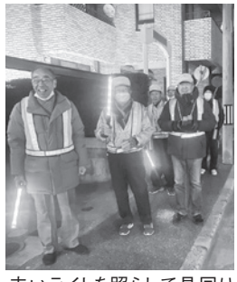
赤いライトを照らして見回り（常磐町付近）

みんなで町をきれいに 年に2回の恒例の「わがまちクリーン大作戦」。今回も子どもからお年寄りまでが参加し、道路や公園、自宅の周りを掃除しました。雑草や枯れ葉などでごみ袋がいっぱいになりました。 12/10