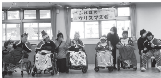
地域活動センターの利用者がハンドベルで『ジングルベル』『きよこの夜』を演奏し、優しい音色をプレゼントしました

それぞれの場所に集まり、画面を共有して、心もつながるひとときでした。 参加 115人