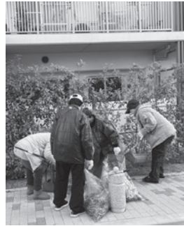
市営住宅前（末広町）

みんなで町をきれいに 年に2回の恒例の「わがまちクリーン大作戦」。今回も子どもからお年寄りまでが参加し、道路や公園、自宅の周りを掃除しました。雑草や枯れ葉などでごみ袋がいっぱいになりました。 12/10