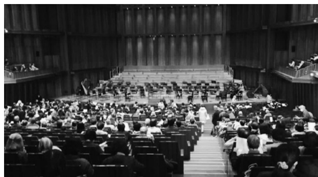
開演前の会場の様子