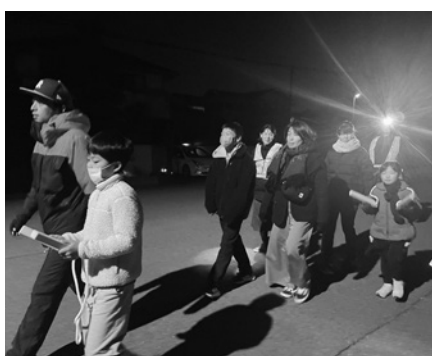
澄み切った夜に響きわたります

寒い夜でしたが、歩きながらおなかの底から声を出したので、終わるころには体がポカポカと温まりました。