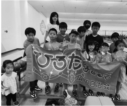
広田子ども会 歓迎会でのポウリング