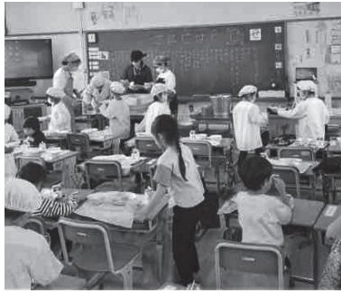
授業サポートボランティア