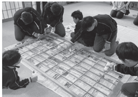
和室の障子の張り替え