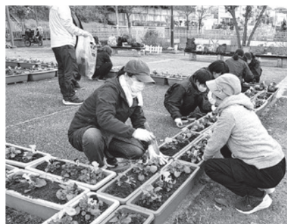
園芸ボランティア