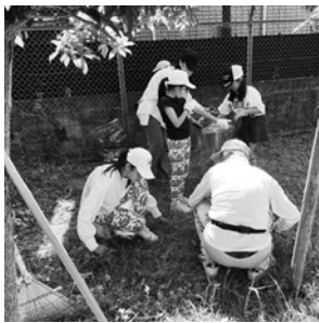
大畑子ども会 自治会と合同でクリーン大作戦

大畑子ども会は、大畑自治会助成の下で活動しており、自治会加入家庭の小学生は全員加入します。(23年度会員数54人)