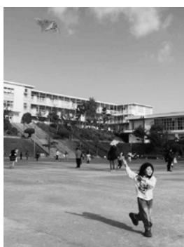
校庭に高く舞うたこ

子どもたちが、たこに思い思いの絵を描き、美術館さながらの素晴らしい作品が校庭いっぱいになりました。