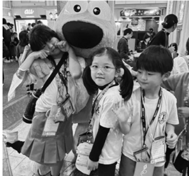
愛宕山子ども会 キッズシア