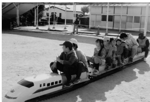
ミニ列車を楽しむ子どもたち