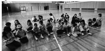
ビンゴゲームにドキドキ

広田小学校の体育館で、昨年12月21日にクリスマス会を行いました。23人の子どもたちが集まり、ビンゴ大会をしたり、ドッジボールやバスケットボールで体を動かしたりして大盛り上がりでした。