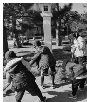
一生懸命に参道を掃くスカウトたち