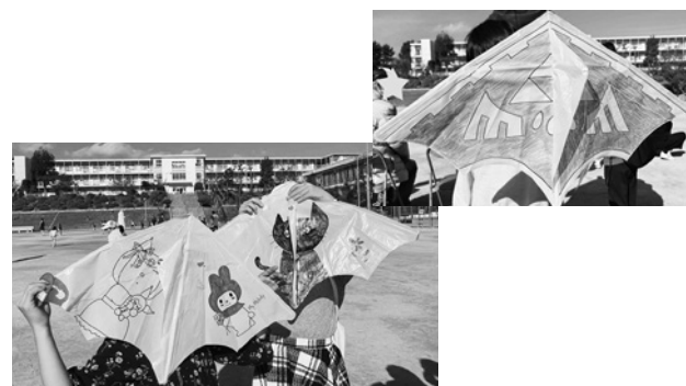
世界でたった一つのたこができました