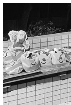
参加した子どもたちにお菓子を配りました