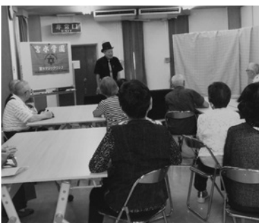
宮水学園のマジックショーにくぎ付

主な活動内容として、毎月1回の役員会、年3回の誕生会、毎週1回の西宮いきいき体操を実施。その他、サークル活動として、カラオケを週1回。また最近ブームになりつつあるポッチャを週1回、有志が集まってプレーしています。また年1回のバスツアーや奉仕活動として大畑公園の清掃、花壇の花植えと水やりなどの手入れ、維持を行っており、行き来する人々の目を楽しませています。 会員募集中です。参加をお待ちしています。