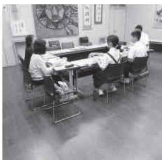
生徒会との交流会