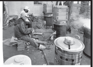
寒い朝、餅つき準備