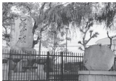
義民碑(左)と義民採水の地の碑文

毎年、鳴尾中学校2年生の「トライやる・ウィーク」で、10〜20人の生徒と共にこの場所に来て、鳴尾の義民の話と碑文の解説を行っています。