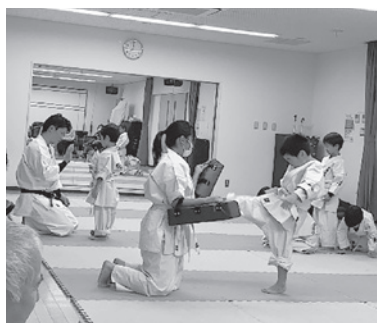
子どもたちに熱心に指導

その指導について尋ねると「指導は楽しいです。練習中はみんなと同じことをして見せるだけ。オフモード時の助言が一番相手に伝わりやすい。やめたいと悩んでいる子には、続けていけば良いこともあるよ」と、自然体の言葉はすぐく納得できました。