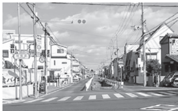
旧国道側から水路を望む

旧国道から本郷学文筋を北に進むと、中央を走る水路には約50m置きに石造りの橋が架かっています。その四つ目の橋、高さ30cmもない橋の側壁には、今なお当時の爆弾の痕跡が残っています。