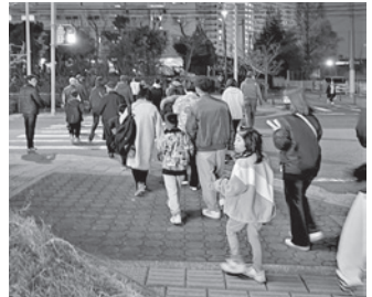
子どもと一緒にパトロール

最終日には、コロナ禍で中止していた「豚汁の振る舞い」があり、おいしそうに食べていました。あちらこちらから「お代わり!」の音が。