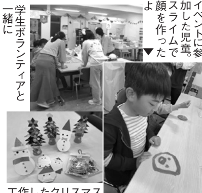
イベントに参加した児童、スライムで顔を作ったよ

実施日：毎週火曜日 16:10～19:00 (祝日はお休み) 住所：西宮市鳴尾町3丁目6-25 ハイツシャローム101(テヌート) 電話：0798-49-8010