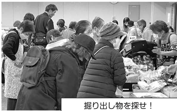
掘り出し物を探せ!

鳴尾社会福祉協議会のチャリティーバザーが昨年11月18日、鳴尾支所3階の鳴尾中央センターで行われました。