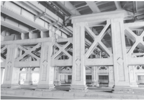
阪神甲子園駅下橋脚(中央部)

阪神甲子園駅のガード下には美しい造形の橋脚が残っています。平成26(2014)年の甲子園駅大改造で、プラットフォーム拡張に伴って北側に2本と南側に3本の円柱が加わりました。一番東側の下に甲子園線のホームがありま