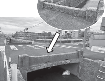
痕跡の残る四つ目の橋の側壁