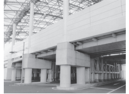
阪神甲子園駅下橋脚(北側)

甲子園筋が枝川の川筋であったことを示す土手があり、松林が茂っています。かつては森のようにうっそうとしていたようです。松林の中に「パーラー阪神」というレストランがあり店内にも松が生えて天