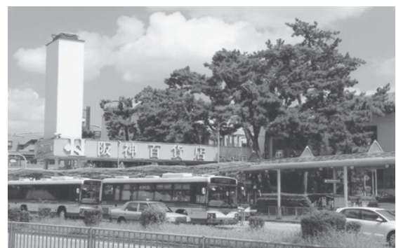
阪神甲子園駅前の松林(平成16年撮影)。白い塔にはボウリングのピンがありました