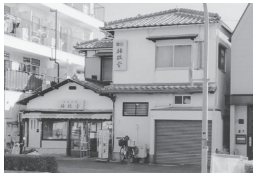
御菓子所・桔梗堂

当時から、上甲子園停留所前(現在は阪神バス「県道上甲子園」)の店が気になっていた。店主は昭和21年ごろのこと。店構えはずっと同じで、昭和の雰囲気が残っています。