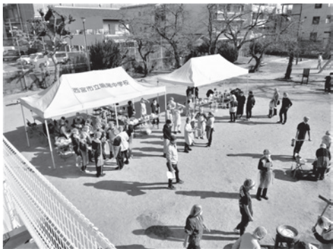
鳴尾中学校生徒が大型テント2張りを設営