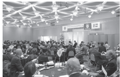
自治会、企業、市関係者など多くの人が参加しました

各自治会長をはじめ、日頃から支援を得ている企業、市関係者などの人たちと年始のあいさつを交わし、交流を深めました。 また、特別ゲストとして阪神タイガースヘッドコーチの平田勝男さんが出席し、会を盛り上げました。