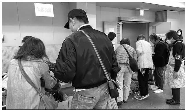
これもいいなあ～! 良品が多くて悩みます

毎年、鳴尾地区全域でバザーの物品を集めています。品物は原則新品に限るとしています。集められたものは食器類や調理器具、健康器具やおもちゃに赤ちゃん用品まで多種多様! バッグだけで一つのコーナーができていました。30畳の和室は、洋服類だけで埋め尽くされていて、中には着物や着物小物まで出品されています。