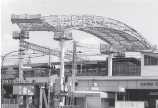
阪神甲子園駅天井鉄柵一番東側を取付

いてみると、開局は昭和9年11月1日で、このパネルは70年記念の際に設置したとのことでした。 甲子園郵便局には、毎年高校野球のセンバツと夏の大会の大会記念小型印をはがきに押ししてもらい、友人たちに近況を伝えるのでお世話になっています。