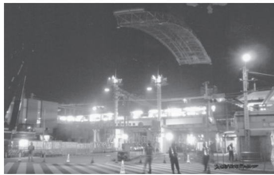
深夜の天井鉄柵取り付け作業

昭和27年12月に甲子園に引っ越してきて、ずっと変わらなかつた駅が、自慢できるほど立派になりました。