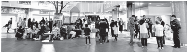
パトロールが終わり、みんなで豚汁を食べました