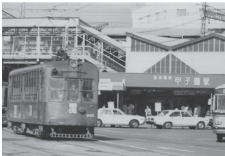
阪神甲子園駅前(昭和49年撮影)

昭和50年5月5日、甲子園線最後の日は、生後5カ月の長女を膝に抱え、家族3人で甲子園から上甲子園まで折り返して記念乗車しました。あれから49年になります。