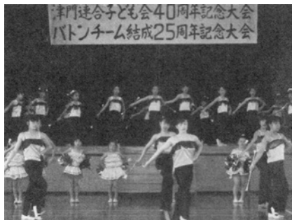
バトンチーム全員の演技

津門川に架かる稲荷橋から仁辺橋までの橋のたもとに、安全柵が取り付けられました。橋のたもととの道路面が以前より高くなつたために護岸が低くなり、川に転落する恐れが出てきたため