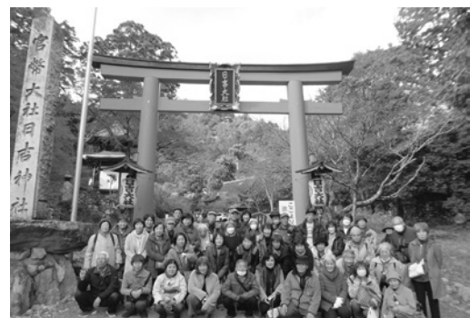
46人のにぎやかなツアーでした

その後、神社近くの芙蓉園(旧白毫院)で、池泉回遊式庭園とモミジを見て、伝統の比叡湯葉料理を楽しみました。