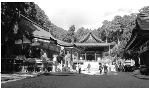
東本宮本殿は国宝

その後、神社近くの芙蓉園(旧白毫院)で、池泉回遊式庭園とモミジを見て、伝統の比叡湯葉料理を楽しみました。