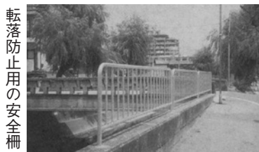
転落防止用の安全柵

約130人が参加しました。種目は少年少女サッカー、バレーボール、卓球、成人バレーボール、グラウンド・ゴルフ、ペタンク、クォーターテニス、バドミントン、ファミリーバドミントン、ミニバスケットボールで週末や夜間を利用して活動しています。