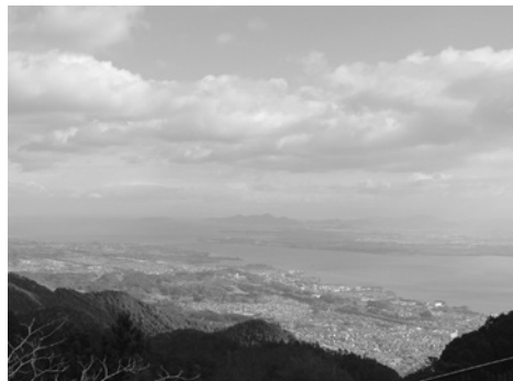
琵琶湖が見渡せます

次に坂本駅からすぐの日吉大社に参詣しました。約13万坪の広大な境内には国宝の東西の本宮と多くの摂社、末社があり、魔除け、災難除けを祈る社です。社殿は檜皮葺きで日吉造りという特有の形をした重厚な歴史的建造物です。また、山王権現とも呼ばれ、神の使いとされる神猿から「魔が去る」「何よりも勝る」に通じるとされています。