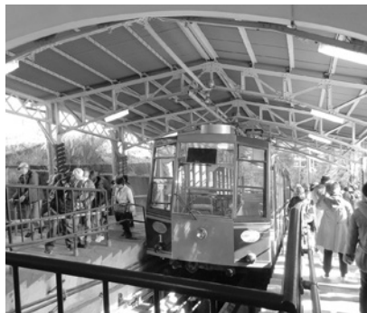
有形文化財の駅舎と坂本ケーブル