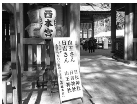
西本宮楼門の軒下の四隅には木造の棟持猿(むなもちざる)がいます