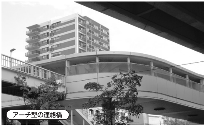
アーチ型の連絡橋