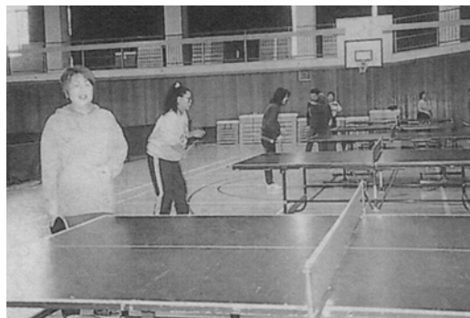
総会終了後卓球で交流

約130人が参加しました。種目は少年少女サッカー、バレーボール、卓球、成人バレーボール、グラウンド・ゴルフ、ペタンク、クォーターテニス、バドミントン、ファミリーバドミントン、ミニバスケットボールで週末や夜間を利用して活動しています。