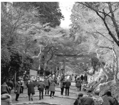
紅葉の参道を散策しながら猿を見ました

次に坂本駅からすぐの日吉大社に参詣しました。約13万坪の広大な境内には国宝の東西の本宮と多くの摂社、末社があり、魔除け、災難除けを祈る社です。社殿は檜皮葺きで日吉造りという特有の形をした重厚な歴史的建造物です。また、山王権現とも呼ばれ、神の使いとされる神猿から「魔が去る」「何よりも勝る」に通じるとされています。