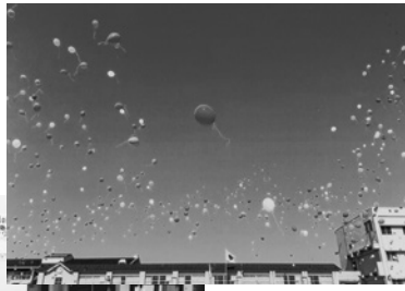
◀高く高く宇宙まで飛んで行け!

児童代表による厄神太鼓の演奏では、校内TV放送の音声を超えて、会場である体育館から生の音が別室にも届き、迫力満点に聞こえてきました。式典のフィナーレは運動場で全校児童による風船飛ばし。