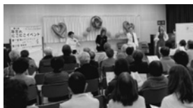
会場いっぱい参加者も楽しそう