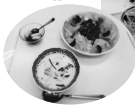
献立はタコライス、ホウレンソウスープ、白玉団子のイチゴソースの3品▼

②1月20日に開催した5歳から中学生対象の震災おむすび体験では、能登半島地震発生後だったため、おむすび一つの温かさや命につながる大事なことを学びました。