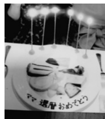
デザートプレートに感激!

最後のデザートサービスでは、全種類を小さくカットして並べてサービスしてくれたプレートに感激しました。2人に感謝した一夜です。さて、次はいつ... S.