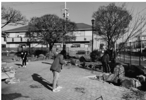
落ち葉やごみをほうきや熊手で集めていきます

昨年12月10日には、西宮市クリーン大作戦に合わせて、年内最後の清掃をしました。この日清掃が始まる前は、公園の至る所にたくさん落ち葉がたまっていました。公園で球技の練習をしていた中学