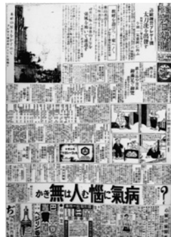
大正14(1925)年の新聞のコピー

誕生日のケーキは毎年手作り、子どもたちが大きくなってからは、自分たちで飾り付けをするなどして楽しんでいます。 誕生日が2月ということもあり、誕生会の後は甲東梅林をみんなで見に行くのが定番です。もう5年生。誕生パーティーもそろそろしなくても良いかもしれない。寂しさと成長を感じています。