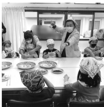
作れるように練習したよ！

②1月20日に開催した5歳から中学生対象の震災おむすび体験では、能登半島地震発生後だったため、おむすび一つの温かさや命につながる大事なことを学びました。