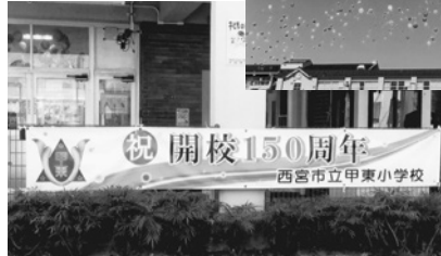
▶目に飛び込んで来る横断幕

「台図より前に風船を手放さないようにしっかりとぎつとかなくちゃ」と、前日に息子が話していたのを思い出しながら準備を見守ります。案の定、いくつかの風船が先に飛んでしまい、ワーツと上がる歓声。青い空に飛び出していくフライングの風船が、私には元気で勢いのある子どもたちの姿と重なり、とてもほほ笑ましく見えました。その後、すぐに広い空へ一斉に放たれたたくさんのお色鮮やかな風船。その様子はまるで、多様な豊かな未来に羽ばたいていく子どもたちを表しているようであり、私は思わず拍手でエールを送りながら、式典の締めくくりを見届けました。