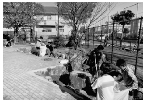
サッカーの練習をしていた小学生とコーチも清掃活動に参加しました