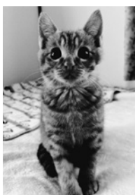
幸せに暮らす“チャーすけ”

その時間でも診てもらえる動物病院にすぐに搬送。体は冷え切っていました。治療のかいあって翌日にはごはんを食べられるまでに回復し、2日後には退院できました。2日後には退院できました。2日後には退院できました。