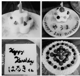
工夫を凝らしたケーキを用意

長男の時はパンと水切りヨーグルトのケーキと、大人用のケーキを作りました。偏食が激しかった次男には、好物の豆腐とトマトで「ケーキみたい豆腐」を、大人には「豆腐みたいなレアチーズケ