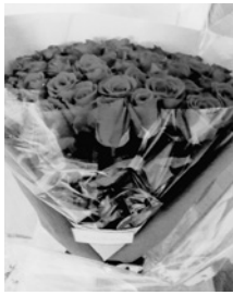
50本の真っ赤なバラ

★最近では、私の誕生日にお祝いらしきこともしなくなっているのですが、20歳以来、夫は10年ごとに年の数の赤いバラを贈ってくれています。