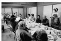
サロンではサンタさんがお出迎え

樋ノ口地区 樋ノ口地区社協では、配分金活用事業として、サロン（9カ所）を無料開放しました。昨年12月に6カ所、今年1月に3カ所、約3000人（ボランティア含む）が参加しました。各サロンの創意工夫が見られ、大いに盛り上がりました。サロンではサンタさんがお出迎え