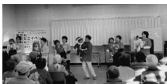
腹話術の動きに会場も大いに沸いて