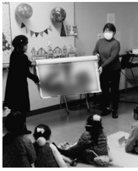
大きな紙芝居に興味津々の子どもたち

クリスマスきやんどるおはなし会が昨年12月20日、段上公民館で開催されました。このおはなし会は、0歳からの親子を対象に、毎週、絵本の読み聞かせをしています。この日は大人と子どもを合わせて33人が参加しました。クリスマススの飾り付けをしたのもより華やかな会場で、クリスマスにちなんだ絵本の読み聞かせ、手遊び、クリスマスソング、パネルシアター、大きな紙芝居など、盛りだくさんの内容でした。