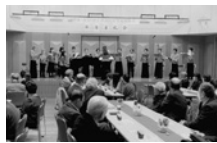
すてきな歌声の中、心も新たに♪

新春早々の1月5日、甲東・段上・段上西地区社会福祉協議会主催の新年互礼会が、アプリ甲東4階ホールで開かれました。