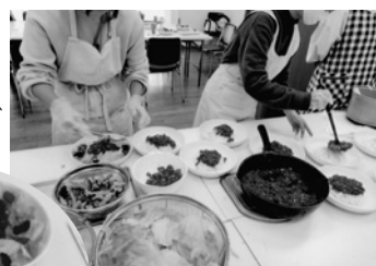
▲今回のメイン料理はタコライス。手際よく彩り豊かに盛り付け

した。「地域ではこのような機会がなかったので、また企画してほしい」とうれしい声が上がりました。また一つつながりが生まれました。