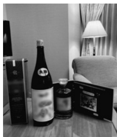
アルバムやお酒のプレゼント

サプライズだったので、みんなが集まり、プレゼントされたことに驚いた様子でした。 I.