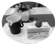
定番のいちごのショートケーキです

新型コロナウイルス感染症の流行のため、実に4年ぶりの開催で、各方面から99人が参加して親交を深めました。