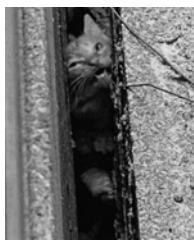
塀の隙間に挟まれていた時の様子

近隣の人が鳴き声に気づいたのは朝6時前。手の届かない、わずか数センチの隙間だったため助けることができず、警察、市役所、動物管理センターへ連絡。センター職員が来ましたが、救出は難航し、時間の経過とともに鳴き声が弱々しくなっていました。