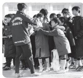
全員にお菓子のプレゼント