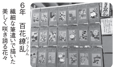
6年 繊細な筆遣いで描いた美しく咲き誇る花々

「つながる思い」をテーマに、立体か平面かどちらか1点を児童が選んで展示していました。