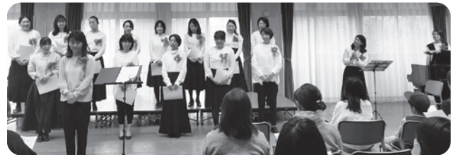
心を合わせて歌いました

上ヶ原小学校と甲陵中学校の合同サークル「ナチュラルハーモニー」は、『生命の奇跡』『Jupiter』『明日への手紙』の3曲を披露しました。発表の後は、観客含め全員でクリスマスソングを大合唱。歌声がなくなぐ絆を大切に、これからも交流の輪を広げていきたいそうです。