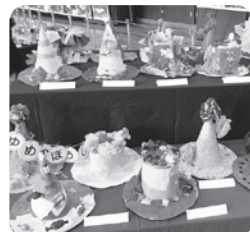
2年 ゆめのぼうし いろいろな形の帽子の上 にカラフルな夢の世界を 表現しています