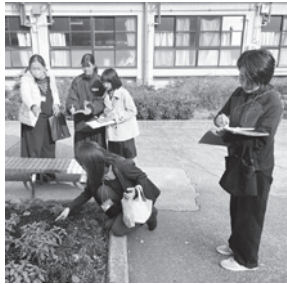
中庭の花壇に植えてある花について聞きました

春には満開の桜が美しく緑豊かな甲陵中学校では、グリーンボランティアの皆さんが花壇や寄せ植えの世話をして校内の環境を美しくしています。中学生編集員がインタビューして原稿を書きました。