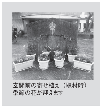
玄関前の寄せ植え（取材時）季節の花が迎えます

メンバーや具体的な活動内容を教えてください。今年度のメンバーは16人です。現役のPTAが10人、子どもが卒業した後も続けて活動している人が6人です。月に2回活動していて、普段は花壇の整美や落ち葉を掃いて学校をきれいに保っています。入学式や卒業式などの行事があるときは、花を買いに行き、寄せ植えを作ったり飾ります。寄せ植えの花はカラフルで周りが明るくなるもので、1年草と多年草を組み合わせてできるだけ長持ちする花を選んでいきます。