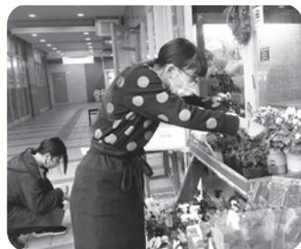
フラワーショップ MARIKO・デザインルーム