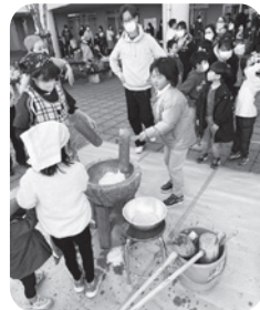
子どもも大人も順番にベツタンくベツタンく