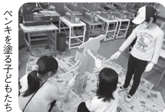
ペンキを塗る子どもたち

今回、約1年ぶりに復活することとなり、「うえみなこどもルーム」の時間に子どもたちに製作の手伝いを呼びかけたところ、50人を超える子どもたちが参加しました。看板を磨いたり、色塗りをしたり、丁寧に作業をして完成させました。