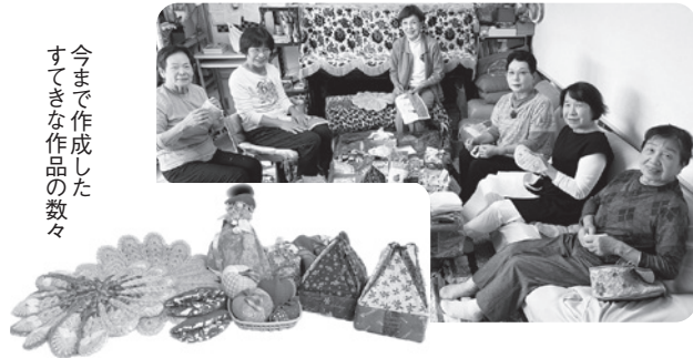
今まで作成した すてきな作品の数々