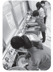
前日、米を洗う子どもたち

日本の伝統行事である餅つきが昨年12月2日、4年ぶりに開催されました。今回は参加した子どもたちにも準備、餅ができる過程、片づけ作業を体験してもらいました。また、感染症対策として、会場で振る舞わず自分で餅を丸めて持ち帰り、火を通して食べてもらうことにしました。来年に向けて課題も残りましたが、想像を超える大盛況でイベントを終えることができました。