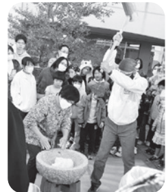
つき手と合いの手がアソボよく。お手本は地域の皆さん