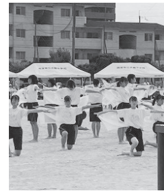
3年女子ダンス「未来」

この日のために学年一丸となって練習したダンスや徒手体操。一生懸命に演技する姿に、観客からはたくさんさんの声援や拍手が送られました。