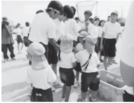
たくさん入るかな？

「全力を魅せろ！ 全力で戦え！」というスローガンには、「何事にも全力で最後までやり切ってほしい。マスゲームでは全員が一つになり全力を魅せ、学年競技や競争競技では自分の力を十分に発揮し、全力で戦えるように」という思いが込められています。全員で準備体操をした後、いよいよ競技が始まります。