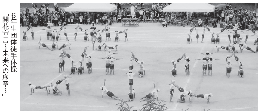
6年生団体徒手体操「開花宣言〜未来への序章〜」

1年生から6年生まで全学年がそろって行う浜脇小学校の運動会が昨年10月14日、4年ぶりに開催されました。午前中のみで、学年リレーと学年競技を行いました。