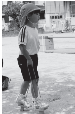
慎重に足げたを進めます

今回が初めての運動会になる年中組は、毎日練習した足げたを披露しました。何度もつまずきました。保護者の温かい声援で、みんな見事にゴールまでたどりつきました。