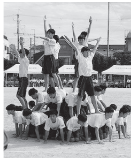
3年男子徒手体操「静と動」