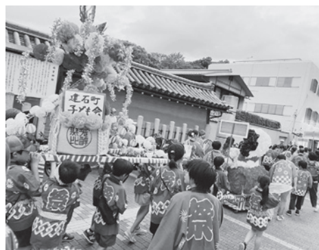
次々に神社を出て門前町へ

「例年より大きめのサイズで誰もが知っているキャラクターにしたので、見ている人から声をかけてもらったり写真撮ってもらったりして、とてもうれしかったし、子どもたちも誇らしい表情だった。完成するまで大変でしたが、その分喜びも大きかったし、町内を巡行した際にはわざわざ家から出て見てくれる人もいてうれしかったです」と荒我町子ども会の育成者から喜びの声が聞かれました。