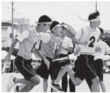
負けられない戦い！

「全力を魅せろ！ 全力で戦え！」というスローガンには、「何事にも全力で最後までやり切ってほしい。マスゲームでは全員が一つになり全力を魅せ、学年競技や競争競技では自分の力を十分に発揮し、全力で戦えるように」という思いが込められています。全員で準備体操をした後、いよいよ競技が始まります。