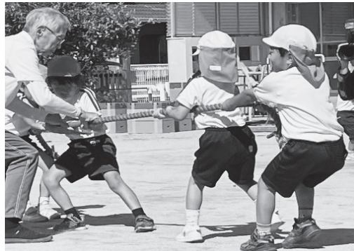
仕切り直して再戦！