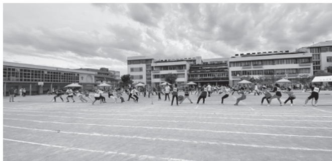
みんなで力を合わせて綱引き