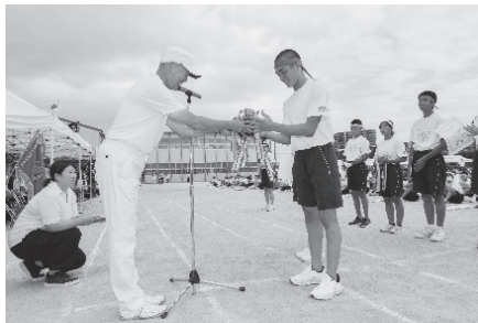
表彰式。お疲れさまでした！