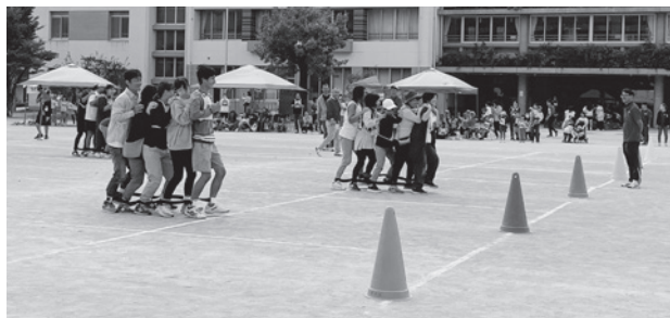
「1,2 1,2」5人1組でムカデ競争

14町2団体（浜脇地区社会福祉協議会、浜脇地区青少年愛護協議会）の総勢650人が参加し、ムカデ競争、ホールインワン、力くらべ、リレーなど、老若男女みんなで楽しみながら、力を合わせて心一つに頑張りました。