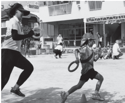
年長組と先生の対抗リレー！ 応援も白熱しました

足げたの他にかけっこ競争や平均台、跳び箱などを軽々とこなしていました。真剣に競技に取り組む年中組の表情は、入園した時よりも少しお兄さんお姉さんになったようでした。