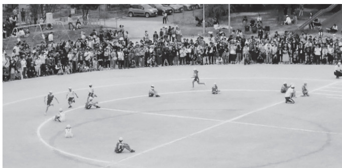
リレーは応援にも熱が入ります