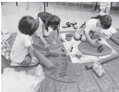
真剣に、慎重にうち作り

9月とはいえ、まだまだ残暑が厳しい中、西宮まつりに向けて、それぞれの町で子ども樽みこしの制作が行われました。今回、浜脇地区子ども会からは建石町、荒我町、産所町、馬場町、前浜町の子ども会が樽みこし巡行に参加しました。