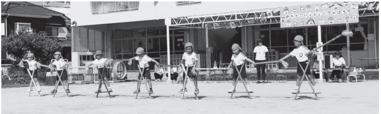
やっとこの大技も見事に決まりました

年長組は人数が7人と少ない中で、大いに盛り上がりを見せました。綱引きでは、力いっぱい綱を引きすぎて転んで尻もちをつく場面もありましたが、すぐに立ち上がり、諦めずに最後まで綱を離しませんでした。