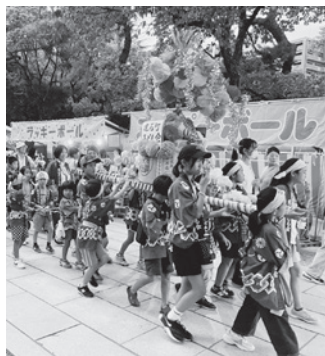
誇らしげな表情の子どもたち

制作した子どもたちからは「それぞれの家でごんばって折ったいろんな色のお花を見てほしい」「おみこし作りは時間がかかって大変だったけど楽しかった。久しぶりの子どもみこしをがんばりたい」といった声が聞かれました。