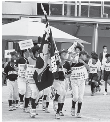
少年野球チーム・浜脇シャークスを先頭にクラブチームの紹介の行進

閉会式が始まる頃には雨がポツポツ降ってきましたが、なんとか片付けまで終えることができました。久しぶりに開催された地区運動会は大盛況でした。