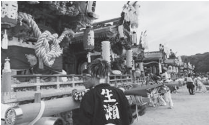
見事な彫刻を施した31基の地車が並ぶ様子は壮観でした

昨年11月4日に大阪城で行われた「地車 in 大阪城 2023」に生瀬宿地車が参加しました。大阪市内を中心に関西の31地域の地車が一堂に会するイベントで、今回で10回目を迎えます。