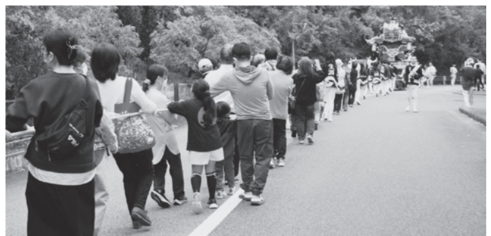
花の峯の急坂を下る