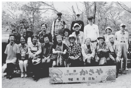
平成21年「シイタケ狩り」の記念写真(『創立50周年記念誌』より)

私たちの「生瀬東部老人ク ラブきずな会」は、創立50周年 を迎えました。2年ほど前か ら、過去の資料を整理して 『創立50周年記 念誌』を発刊し ました。 ふり返ると、 国道176号を 中心にした生瀬 東部地区は、60 年ほど前はカエ ルの鳴く水田が 広がり、旧国鉄 の蒸気機関車の 汽笛が聞こえて くる風光明媚な 地区でした。 一方、当時国 道176号は歩 道もなく、道幅 も狭かったため 歩くのはひやひ やでした。今で は想像もつきま せん。