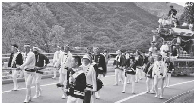
初めて青峯連絡道を巡行