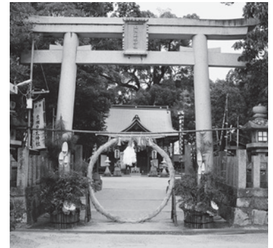
生瀬皇太神社のお正月風景