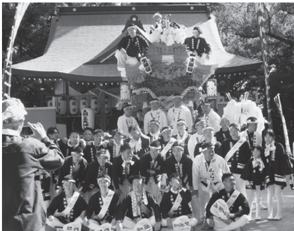
宮出し前に本殿前で記念写真

地車は花の峯地区でも大歓迎を受けました。花の峯からは長い下り坂となるため、地車の向きが変わります。綱の曳き手も後ろに移動しました。急坂を地車が滑り落ちないよう、綱の曳き手も必死に踏ん張っていました。その後、地車は北摂中央病院に向かいました。 (広報)