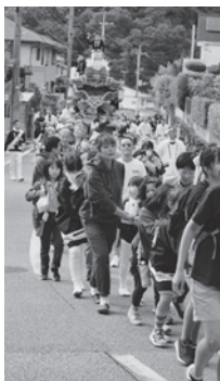
青葉台急坂を上がる