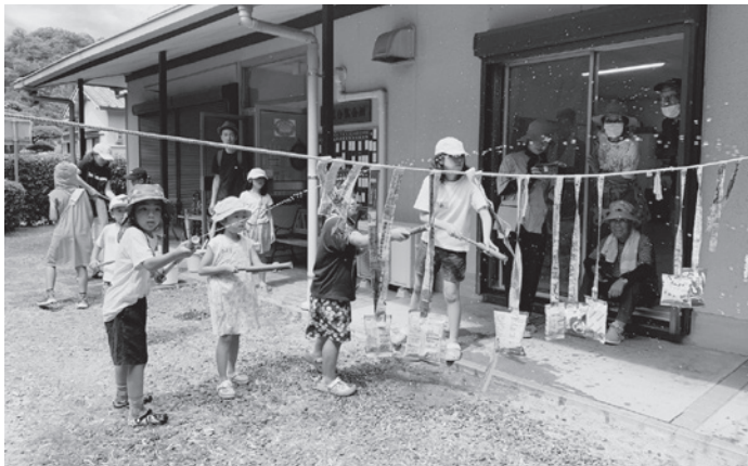
みんなそろって竹鉄砲の試し撃ち

える参加者が竹鉄砲作りやプール遊びを楽しみました。また、今年度は秋祭りの内容変更に伴い、活動費捻出のため生瀬地区盆踊りへの出店にも挑戦しました。