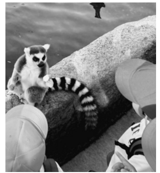
△園外保育 (王子動物園・11月7日) △