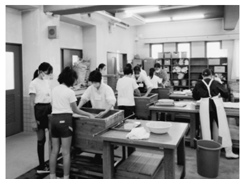
△本番前の練習 (名塩小)

できる。6台の漉舟で、予定より早く、個人記念撮影もスムーズに行われ、子どもたちには忘れられない1日となった。 〈東山台小〉 32回目、卒業生は昨年より5人減の2クラス79人。ほぼ全員ががきサイズの経験者だが、大きい桁は初めてで、苦戦しながらも、支援ボランティアの保護者や同館実習助手らに励まされながら全員無事に漉き終えた。 両校とも上々の出来栄とのことで、印刷に出されたのち、漉き込まれた名札に従い、児童名と生年月日などが書き込まれて、3月21日の卒業式で卒業生一人ひとりに手渡される。