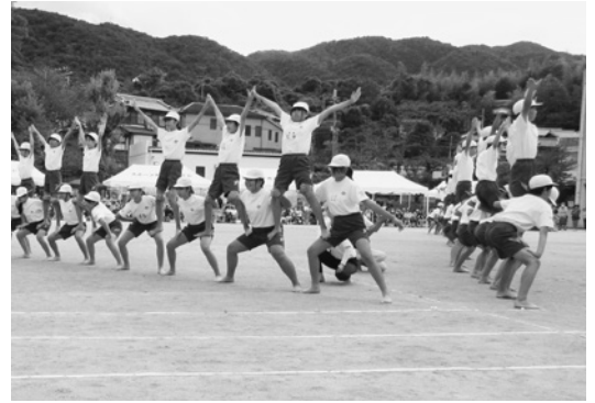
▽運動会 (塩瀬体育館・10月8日)