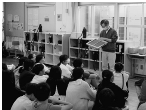
△オリエンテーション (名塩小)

本番に先立ち、10月19日、両校でオリエンテーションが行われ、児童代表が「6年間の思い出を込めて一生懸命漉きます」と元気に宣誓。和紙学習館の指導員から絶対に失敗せずにきれいに漉くコツなど、ワンポイントレッスンを受けた。今年から紙漉き指導補助の農協職員が減員されたため、地域の有志や保護者のボランティアが新たに加わって手助けをした。 欠席・転入児童は1月9日に漉く予定。 〈名塩小〉 39回目、卒業生は昨年より10人減の3クラス86人。漉 す 桁は両校同じで間仕切りの入ったB4大のもので、一度にB5判の証書を2枚漉くことが