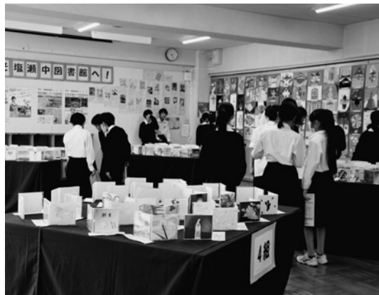
△文化活動発表会 (10月27日)