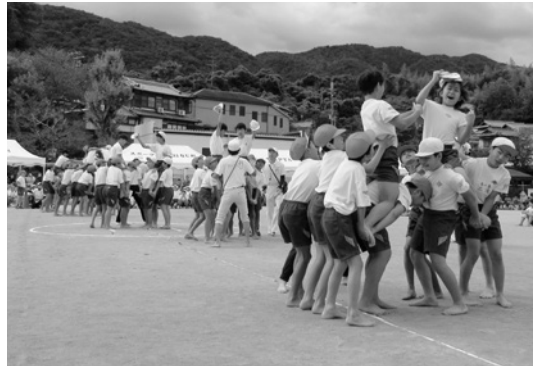
名塩小 体育会 10月21日