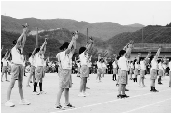
東山台小 体育会 10月14日