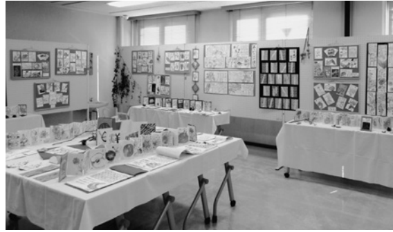
絵手紙 あじさい (11月3・4日) △