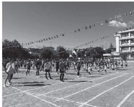
最後はグラウンドに整列

最後の競技、120mリレーでは、お父さん、お母さんの一生懸命走る姿に子どもたちが大きな声援を送り、大いに盛り上がりました。