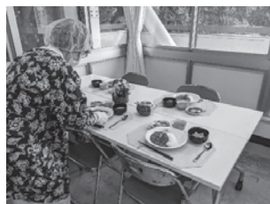
配膳するスタッフ