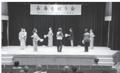
客席からも参加して「夙川会民謡クラブ」