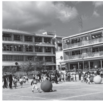
大玉をころがしてリレー