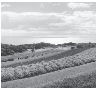
すばらしい風景に心癒やされます

自治会員79人が昨年10月10日、淡路島へのバス旅行に出かけました。まず訪れた淡路花さじきは鮮やかな赤のサルビアが咲き誇っていました。次に、淡路産の酒米を使った地酒を味わえる、千年一酒造で酒蔵の見学と6種の酒の試飲。昼食は「うめ丸」の豪華な鯛づくし料理を堪能しました。その後、たこせんべいの里でお土産を買