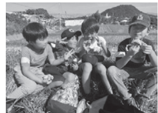
ホクホクでおいしいね

そして、稲刈りの済んだ田んぼで火をおこし、焼きイモを作りました。青空の下、みんなで食べる焼きたてのイモはとびきりおいしかったようで、笑顔で頬張っていました。