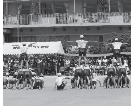
6年生の「団体徒手体操」