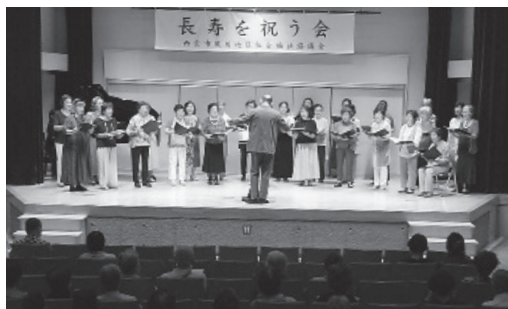
懐かしい歌を披露「夙川コーラス」