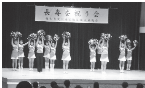
かわいい子どもたちのチアダンス「夙川ハッピーラビッツ」

川太鼓の演奏が始まり、室内の舞台では歌やダンスなどがあり、参加者は大きな拍手をして楽しんでいました。 喫茶室も復活し、お楽しみ福引では笑顔があふれていました。