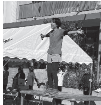
NOBY T&F CLUBのコーチも務める中村さん

今回は夙川小学校出身で北京オリンピック女子マラソン日本代表の中村友梨香さんが来場し、「中村さんとりズム体操」や「障害物競走」など多くの競技に参加しました。