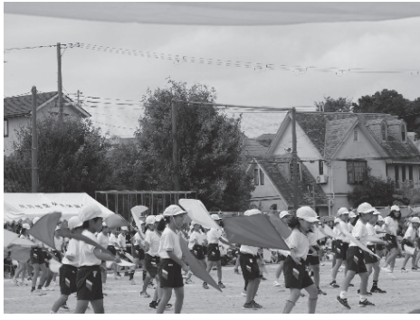
4年生の「和っしょいフラッグ」

また、1年生から4年生は、それぞれ帽子やポンポン、手袋、旗を使ってカラフルで楽しいダンスを披露。5年生は力強い『ソーラン節』、6年生は団体徒手体操『花鳥風月』を披露しました。