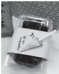
心のこもった手作りおはぎ。 あつという間にみんなのお なかに入ったことでしょう

午前9時から、配食ボランティアを中心に、次世代につなげるために、新メンバーも加えてみんなで心を込めて、約600個(300セット)のおはぎを作りました。