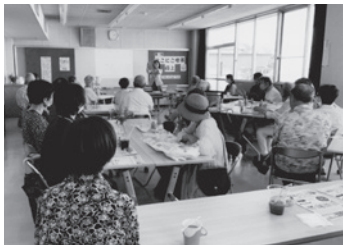
おいしいコーヒーを飲みながら しっかり勉強もできて一石二鳥

第3回は12月に感染症、最終回は2月に花粉症対策と、身近なテーマでセミナーが開かれ、毎回勉強になる喫茶です。