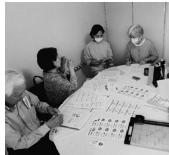
準備をする実行委員のメンバー

ゲームのチケットやヨーヨー釣りのこより作りなどを行いました。また、当日のボランティアとして、10人の協力を得ることになり、実行委員は、祭りを支える仲間の増員を喜んでいました。