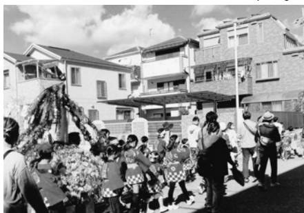
町内を練り歩く神輿の列

太鼓の音に誘われて家から出てきた人が、子どもやスタッフに声をかけて応援していました。