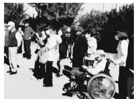
防災意識をみんなで共有

避難場所となった上大市公園には、車いす利用者を含め住民約80人が参加し瓦木消防署員の指導による水消火器を使った訓練を体験。訓練後は集会所で、自分ができる災害への備えについてのビデオを視聴しました。 7月に当マンションの近くで発生した火災を、住民や管理人の迅速な連携で初期消火し、瓦木消防署より感謝状をいただきました。このような身近な事例により、防火への意識が高まりました。 消防訓練の実施に向けて、自治会、管理組合、管理人さん、ボランティアの人たちの協力によって成功裏に終えることができました。 自治会員