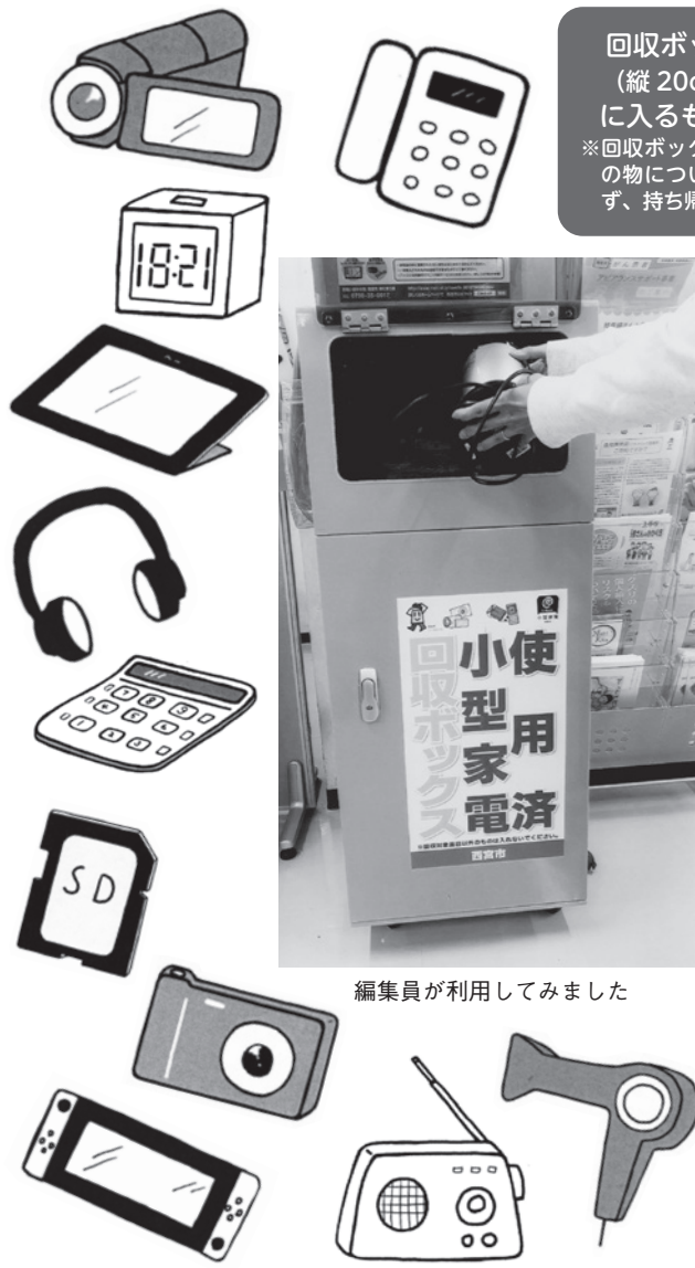
編集員が利用してみました

回収ボックスの投入口 (縦 20cm× 横 35cm) に入るものに限ります。 ※回収ボックスに入らない大きさ の物については、無理に投入せ ず、持ち帰ってください