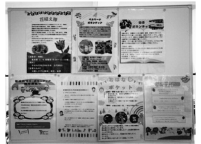
ボランティア団体の紹介パネル 興味があればぜひ来てください！

カフェでは、各ボランティア活動の紹介や、子どもたちと地域団体との交流活動などがパネル展示されました。併せて、スライドショーで子どもたちの普段の学校の様子を見ながら、参加者たちはおいしい飲み物やお菓子とともに、和気あいあいと楽しい時間を過ごしました。