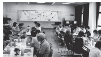
← 久しぶりにみんなで顔を合わせて 楽しい食事

不自由を感じている人たちに目を向ける。これこそが「共に生きる」原点ではないでしょうか。