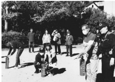
消火器の使い方を体験。子どもも大人もチャレンジ!

新しい試みとして住民からボランティアを募り、総勢30人の自衛消防隊をつくりました。役割として、本部、通報係、防衛安全係、各階担当の誘導係、避難状況記録係、交通安全係などが配置されました。