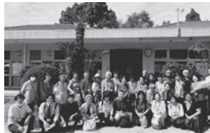
地域ボランティア26人で、 久しぶりのバスツアー

この過疎化による住民の暮らしづらさを改善しようと、平成22(2010)年から地区の住民が集い、「山田地区まちづくり協議会」を設立。旧山田保育園の空き教室を利用して、いきいき100歳体操や生け花教室などを開催しています。また、住民の足として運行しているコミュニティバス「ハピバス山田号」の事務所としても活用しています。これが現在、住民から親しまれている「ごきげん荘」です。