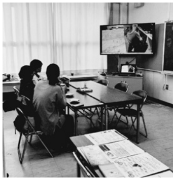
参加費100円。くつろげる場所です

昨年10月25、26日の2日間、樋ノ口小学校の会議室で、コミュニティ・スクール主催の「コミュニティカフェ」が行われました。「小学校でどんなボランティア活動が行われているか知ってもらいたい」「学校や地域とのつながりを深め、保護者同士での情報交換ができる、ほっとひと息つける場所をつくりたい」という趣旨で、初めて開催されました。